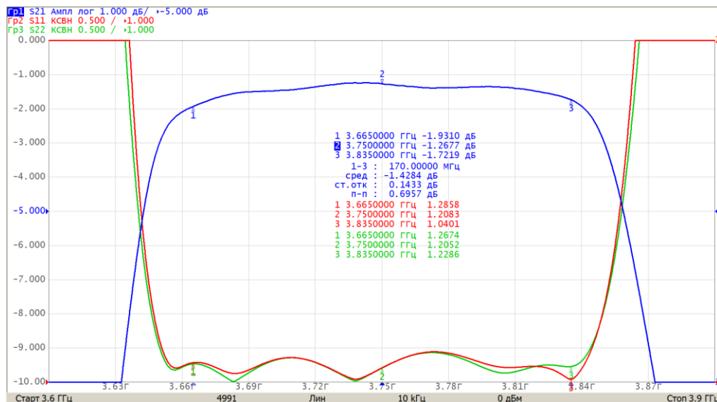
АЧХ и КСВН входа/выхода в узком диапазоне частот

Волновое сопротивление входа/выхода – 50 Ом